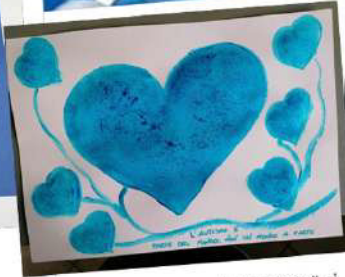
In lingua Maori, la parola "autismo" si pronuncia "takiwatanga", che tradotto vuol dire "nel suo tempo e nel suo spazio". Un bambino autistico non ti sta addosso. Sta semplicemente