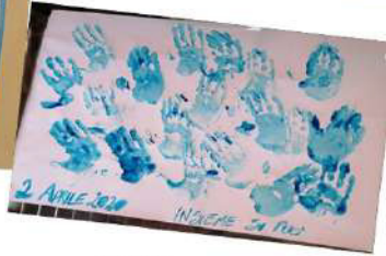
INSIEME SI PUO'!