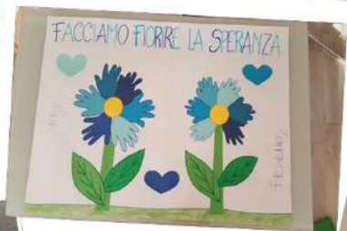
Facciamo fiorire la SPERANZA