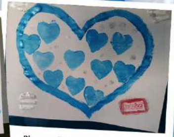
Blu come il cielo limpido, come il mare cristallino, come il significato della serenità che ha questo colore. Quel blu che ti ricorda che l'equilibrio da raggiungere, in una sfida così grande, non è poi un'un'utopia! AUTISMO, NON CI FAI PAURA!