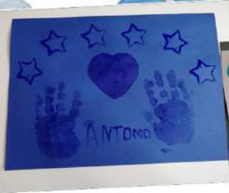
L'autismo non è un muro. L'autismo è una porta speciale. Se trovi la chiave giusta e hai il coraggio di aprirla si spalanca il cielo.